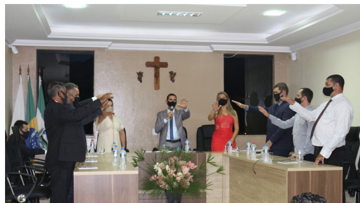
São João do Manhuaçu