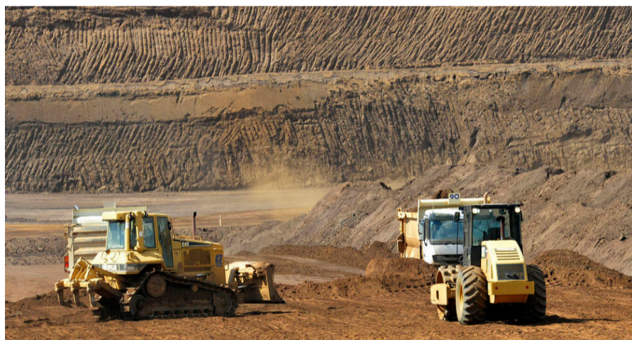
Entidades representativas são contra a mineração em Manhuaçu e cidades da região