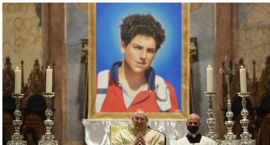
A Santidade do Beato Carlo Acutis